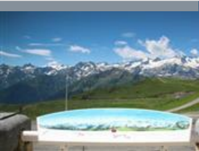
TABLE D'ORIENTATION DE SUPERBAGNÈRES