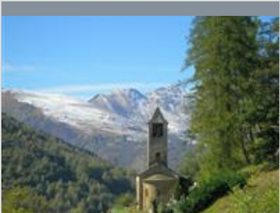
POINT DE VUE AU VILLAGE

Vue imprenable sur les pics pyrénéens. Maître d'oeuvre : Villages clubs du soleil Réalisation : Empreinte-sign Dessin : Florence Gonzalez Date : 2012